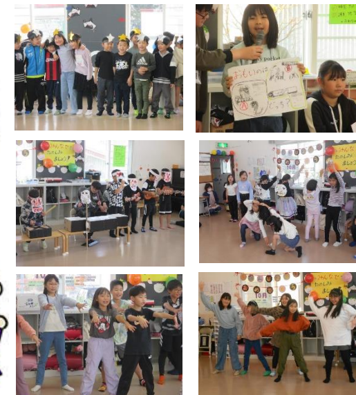
学童ホームページにもたくさん掲載しています