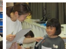
ビンゴになった人は食に関するインタビューを受けます